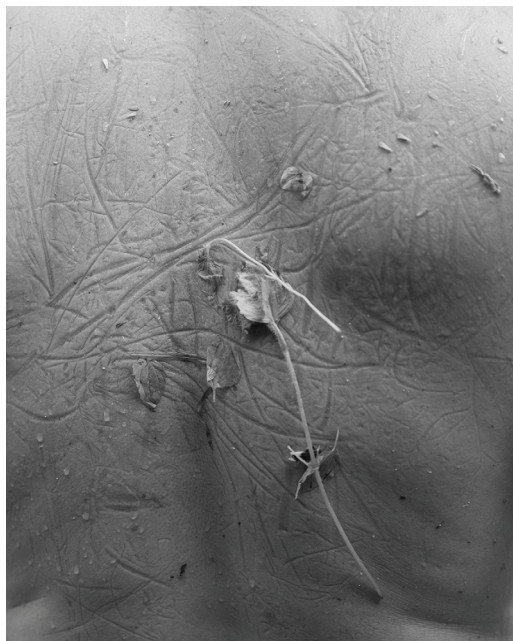
7. attēls. Sērijā "Riti raiti rīta rasa" (kopš 2019. gada) iekļauts, taču plašākai auditorijai nerādīts attēls. Pateicība māksliniecei