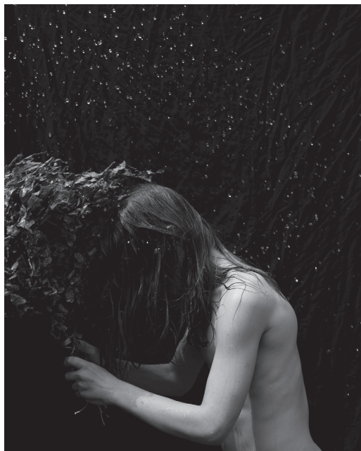
5. attēls. No sērijas "Riti raiti rīta rasa". Pateicība māksliniecei

uz to, ka antotipijas tehnikā tapušās fotogrāfijas vēlāk pārklāja ar laku, kas aiztur ultravioleto starojumu, daži portreti laika gaitā izbalēja. 8