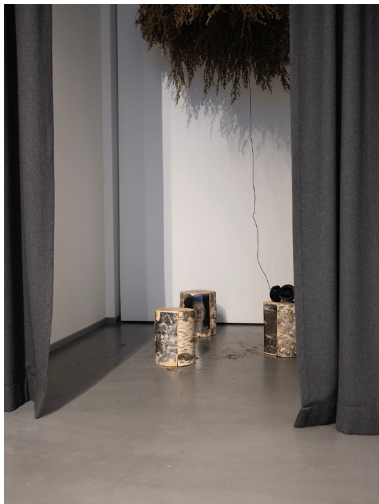
2. attēls. Skats no izstādes "Riti raiti rīta rasa", 2021. gads.