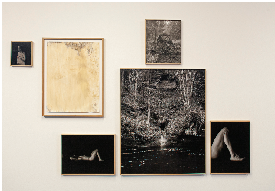
1. attēls. Skats no izstādes "Riti raiti rīta rasa", 2021. gads.