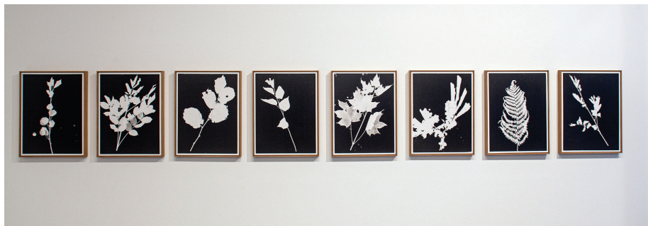
6. attēls. Skats no izstādes "Riti raiti rīta rasa". Pirts slotas fotogrāmmas, 2021. gads.

pasīva lieta, nedz izrāde – māksliniece parāda tā ciešo mijiedarbību ar pirts vidi, ūdeni un augiem. Vairākās fotogrāfijās redzam arī citus dabas elementus – avotu, āliņģi, ezeru, sniegotu lauku, klinti, mežu, sakaltušu koku. Vizuali tie sasaucas gan ar citām mākslinieces darbu sērijām, gan ar mežā filmēto Pūces un Novikovas performanci.