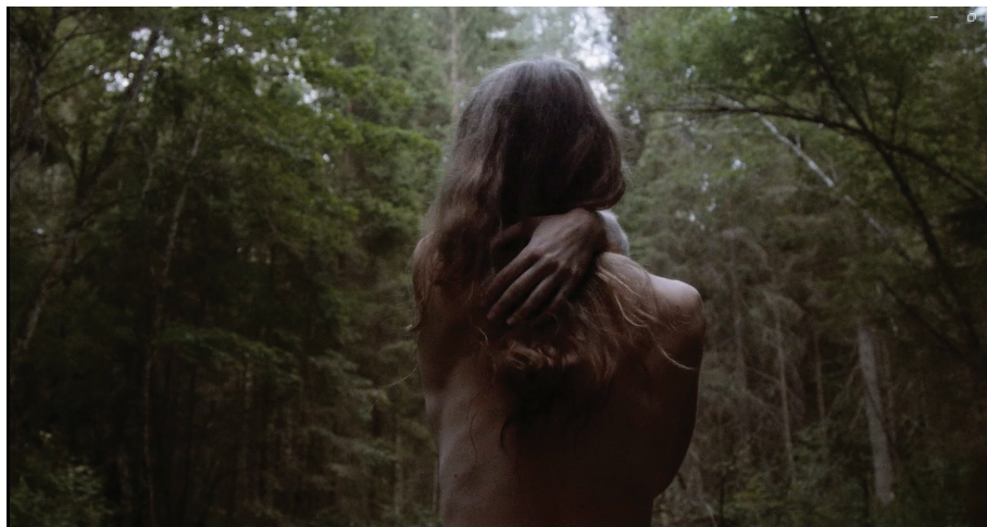
3. un 4. attēls. Iepriekš nepublicētas performances dokumentācijas stopkadrs. No sērijas "Riti raiti rīta rasa", 2021. gads. Pateicība māksliniecei

materialitātes un tehniskās realizācijas procesa daļa. Sērijā ir vairāki antotipijas fototehnikā veidoti darbi – tas ir 19. gadsimtā radies paņēmieni, kad attēlu pārnes uz papīra, kas piesūcināts ar emulsiju, tai reaģējot uz ultravioleto starojumu. Šajā gadījumā kā emulsiju māksliniece lietoja sulas no augiem, ko izmanto pirts rituālos, kā ozolu, liepu, samtenes u. c. Lai iegūtu rezultātu, darbi bija jātur saules gaismā, dažos gadījumos tas ilga vairākas nedēļas un pat mēnešus. Attēla tapšanu raksturo ilgstamība un procesualitāte, augu un saules staru mijiedarbība jeb attiecības, kā arī autorei pacietība un samierināšanās, ka iegūtie attēli būs fiziski trausli. Neraugoties